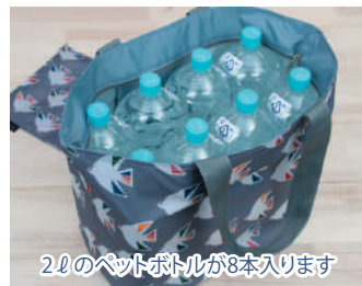
2Lのペットボトルが8本入ります