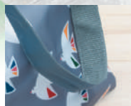
重いものを運ぶ時も 腕や肩が痛くならない やわやか持ち手