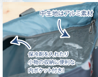
中生地はアルミ素材 保冷剤を入れたり 小物の収納に便利な 内ポケット付き!