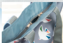
開口部はマチ付きで 便利なダブルファスナー